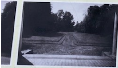
Vaizdas į parką XX a. 3-ias dešimtmetis