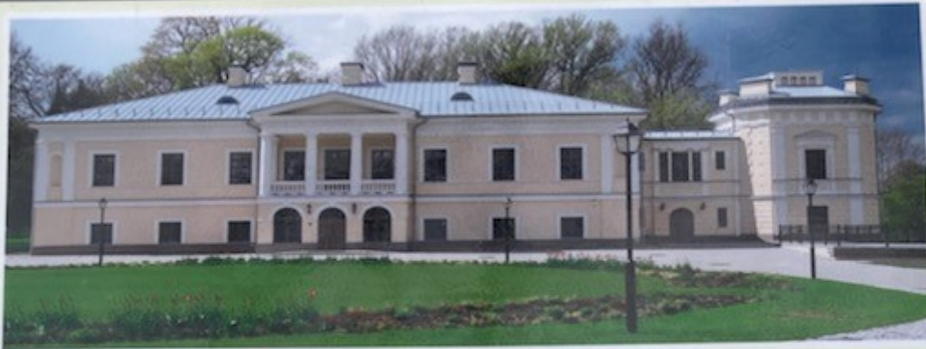
Dvaro rūmai po rekonstrukcijos 2017 m.