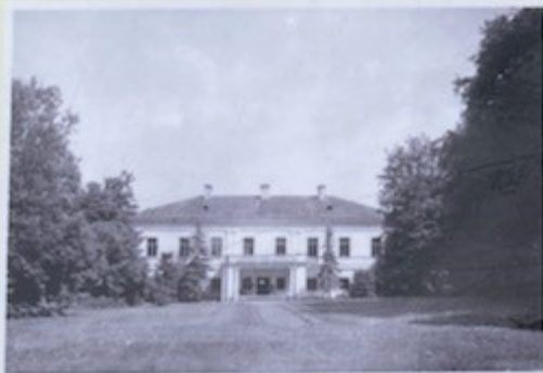
Rūmų fasadas iš parko pusės 1937 m.