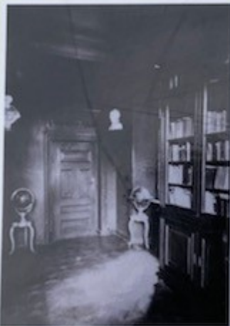
Biblioteka 1932 m.