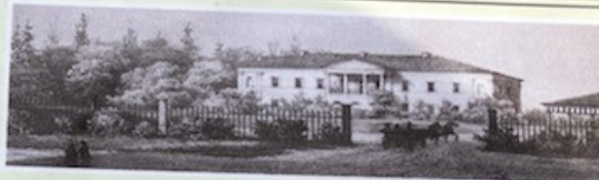
Dvaras XIX a.