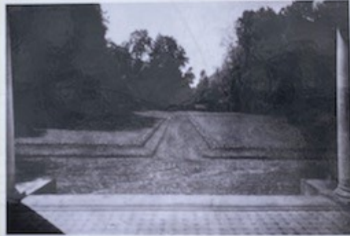
Vaizdas į parką XX a. 3-ias dešimtmetis